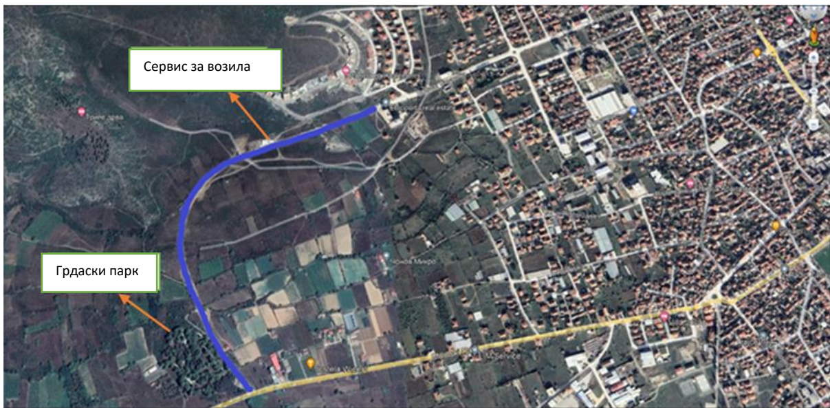
Слика 1 Локација на локалната улица „Св. Климент Охридски“ во општина Гевгелија

Локацијата на локалната улица „Св. Климент Охридски“ е прикажана на Слика 1, а нејзината сегашна состојба е прикажана на Слика 2.