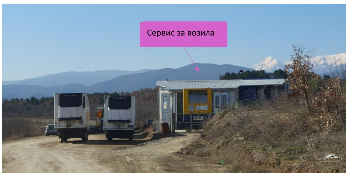
Слика 2 Постоечка состојба на локалната улица „Св. Климент Охридски“ во општина Гевгелија за време на теренската посета на ден 15.02.2023

Овој проект припаѓа во поглавје XI – Инфраструктурни проекти, точка 1 – Рехабилитација на локални улици, поради што е потребно да се изработи Елаборат за заштита на животната средина. Елаборатот за заштита на животната средина за проектот е изработен во ноември 2018 година од страна на ГЕИНГ Кребс унд Кифер Интернејшанал ДОО. Решението за одобрување на Елаборатот за заштита на животната средина за улицата „Св. Климент Охридски“ со број УП1 бр. 11-18 е издадено од страна на Општина Гевгелија на 06.02.2023 година (Анекс IV).